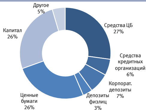
Структура пассивов, III кв. 2009 г.