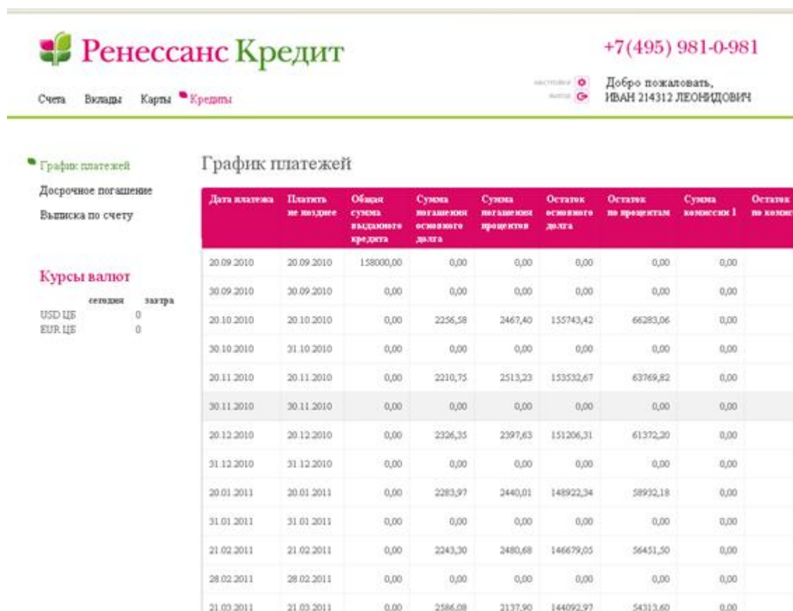
Рисунок 1.17. График платежей